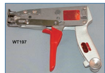
工具目盛と締め付け強度の関係